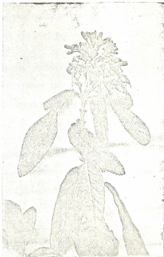
Ramo de "Icó branco" com flores.