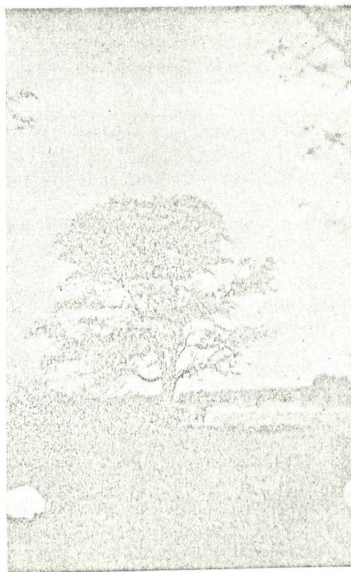
Craibeira em flôr