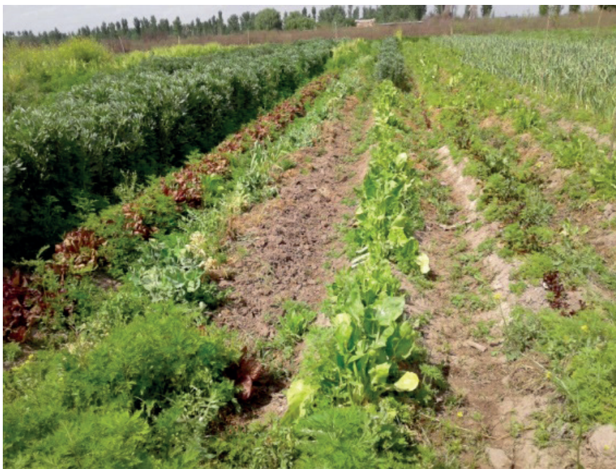
Figura 4. Paisagem agrícola com produção familiar de hortaliças em Mendoza.

destacam-se: couve-flor, tomate, salsa, repolho, brócolis, inhame, pimentão e alface. (Pereira, 2013).