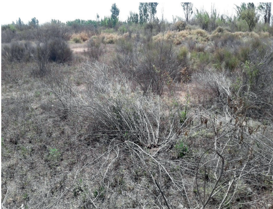
Figura 3. Paisagem natural com característica desértica em Mendoza.