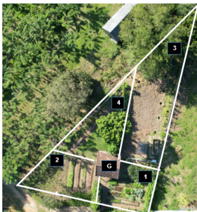
Figura 1. Foto aérea da área destinada ao quintal produtivo, com detalhamento das quatro subáreas existentes. Seropédica/RJ, 19/06/2023.

A fim de melhor organizar a área total do quintal, o espaço foi subdividido em quatro subáreas numeradas de 1 a 4, conforme mostra a FIGURA 1, tendo um galinheiro (G) no centro. A subárea 1 apresenta uma condição a pleno sol e está destinada ao plantio de hortaliças convencionais em quatro canteiros medindo 7m de comprimento e 1,0m de largura, com um espaçamento entre si de 0,4m, estando presente ainda um aceroleira e plantios espaçados de pimenta biquinho e manjeriço.