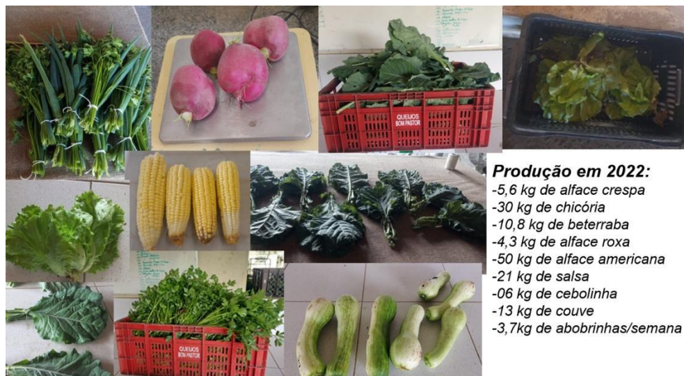
Figura 3. Hortaliças colhidas no quintal produtivo da Fazendinha Agroecológica em 2022. Seropédica/RJ.

Os dados parciais coletados em 2021 e apresentados no presente Relato, representam somente a produção de quatro canteiros de 7m 2 cada, isto é, 28m 2 no total. Em 2023 além da produção de hortaliças convencionais, estão sendo esperados as produções das PANC estabelecidas em 2023, dos cultivos nas cercas, como por exemplo, chuchu e bortalha, além do início da postura de ovos que terá início em setembro do ano corrente. Tal produção demonstra o potencial que os quintais têm no combate à insegurança alimentar, sendo capazes de ofertar uma