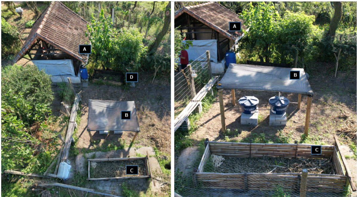
Figura 2. Tecnologias sociais existentes no quintal produtivo. A. Captação de água de chuva do telhado do galinheiro; B. Captação de água de chuva por meio de um coletor plástico; C. Minhocário; D. Gongolário. Seropédica/RJ, 19/06/2023.