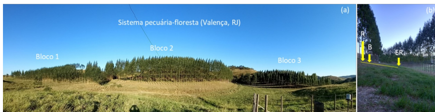
Figura 1. Vista geral do experimento (a) e dos locais de coleta de amostras de solo (R: renque; B: borda e ER: entre renque) - Crédito Fabiano de Carvalho Balieiro, Embrapa Solos.

A coleta de solo se deu nos terços superior, médio e inferior das encostas, em dezembro de 2022 e janeiro de 2023, entre o 35º e 40º meses de idade do plantio, descartando os renques superior e inferior de cada bloco. Em cada terço foram coletadas amostras compostas (3 simples) nas profundidades de 0-10cm, 10-20cm e 20-40cm e em três distâncias dos troncos (renque, borda (cerca de 2,0 m do renque e no entre renque, a cerca de 7,5m de distância dos renques adjacentes) (Figura 1). As amostras foram secas ao ar, peneiradas a 2mm e acondicionadas em sacos plásticos. Para fins de análise química e isotópica as subamostras foram finamente moídas com auxílio de pistilo e gral, até textura de talco. Posteriormente foram encaminhadas para Laboratório de Biotransformação de Carbono e Nitrogênio (LABCEN) da Universidade Federal de Santa Maria (UFSM), Santa Maria/RS para determinação do C total (g kg -1 ) pelo analisador elementar e da abundância natural do 13 C (em ‰). A abundância de 13 C nas amostras de solo é expressa como \delta^{13}C , que é uma medida que se refere a um padrão expresso em partes por mil: (amostra 13 C/ 12 C - padrão 13 C/ 12 C) \delta^{13}C (‰) = x 1.000. O padrão internacional é V-PDB (Vienna-Pee Dee Belemite).