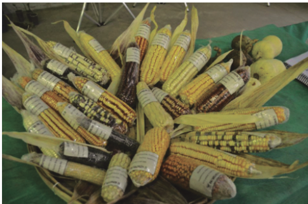
Fig. 2 - Milhos de Ibarama

“Tradicionalmente, se tira as pontas, e aí, no meio do milho, fica essas car-reirinhas mais padrão, né? Antigamente se dizia, né? Os antigos dizem ainda, que as parte de trás do milho produzem o milho mais tarde. Então, ele demora a se desenvolver.