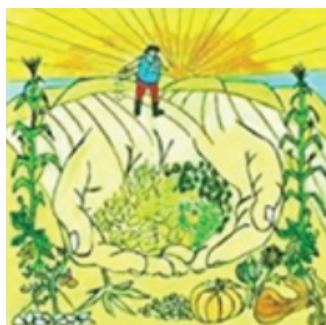
Fig. 3 - Logo do Banco de Sementes Crioulas do Gaia

Este mecanismo permite que cada família tenha acesso a uma diversidade varietal. Além disso, a produção comunitária de sementes possibilita a troca de saberes entre os guardiões e guardiãs envolvidos, através da participação em eventos, reuniões e durante a própria gestão coletiva. Ademais, representa a concretização do direito dos agricultores e o efetivo exercício da autonomia dos atores sociais envolvidos no projeto, fundamentais à materialização da Agroecologia como forma possível de produção.