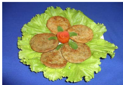
Figura 1. Hambúrguer de peixe.

O hambúrguer (Figura 1) pode ser definido como um aglomerado de carne moída ou picada, onde são adicionados sal de cozinha e de cura, além dos condimentos, sofrendo em seguida uma moldagem e o congelamento. Segundo o "Regulamento Técnico de Identidade e Qualidade de Hambúrgueres" na instrução normativa n.20 estabelecido pelo Ministério da Agricultura e Abastecimento, são definidos os parâmetros (Tabela1): adição máxima de proteína não carne na forma agregada de 4%, teor máximo de carboidratos totais 3%, gordura máxima de 23%, proteína mínima de 15% e teor máximo de cálcio em base seca de hambúrguer cozido 0,45% e nos crus de 0,1% (Brasil, 2000a).