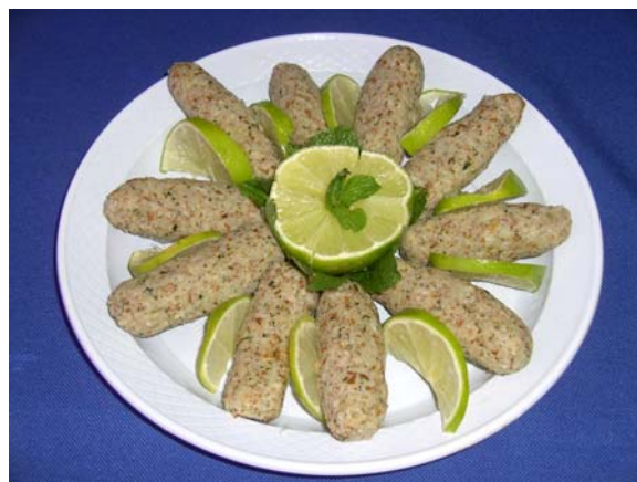
Figura 4. Quibe de peixe.

Quibe é um produto cárneo obtido de carne bovina ou ovina moída adicionado de trigo integral acrescido de ingredientes. Quando a carne utilizada não for bovina ou ovina, será denominado de quibe seguido do nome da espécie animal de procedência. O produto deve conter no mínimo 11% de proteína e no máximo de 0,1% de cálcio em base seca (Brasil, 2000a).