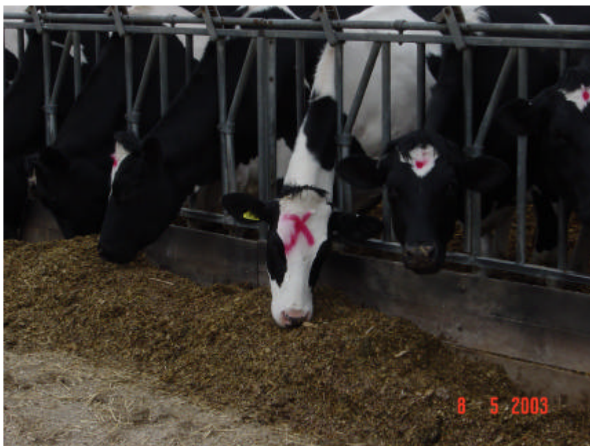
Fig. 5. Gado leiteiro consumindo silagem de girassol.

com silagem de girassol. Vandersall e Lanari (1973) observaram maiores ganhos de peso e produções mais elevadas de leite para vacas alimentadas com silagem de milho, quando comparadas às vacas alimentadas com silagem de girassol. Thomas et al. (1982a) encontraram produções de leite equivalentes em dois grupos de vacas em lactação, alimentadas com silagens de girassol e de alfafa, concluindo que a silagem de girassol é uma forragem adequada para vacas em meio e final de lactação. Valdez et al. (1988b) observaram que vacas holandesas alimentadas com silagem de girassol apresentaram maior ganho de peso e igual produção de leite que aquelas que receberam silagem de milho. Entretanto, Hubbel et al. (1985), comparando silagens de girassol e de milho para vacas Jersey em lactação, observaram que a produção de leite foi significativamente maior para as vacas alimentadas com silagem de girassol (4,9 libras a mais por dia). Silva et al. (2004), ao avaliarem a produção e a composição do leite de vacas com média de 26 kg/dia alimentadas com diferentes proporções de silagem de girassol em substituição à silagem de milho, concluíram que a inclusão parcial da silagem de girassol se mostrou viável, pois não afetou significativamente as produções de leite, de proteína ou de gordura. Já a substituição completa afetou negativamente as produções de leite, de proteína e de extrato seco total do leite.