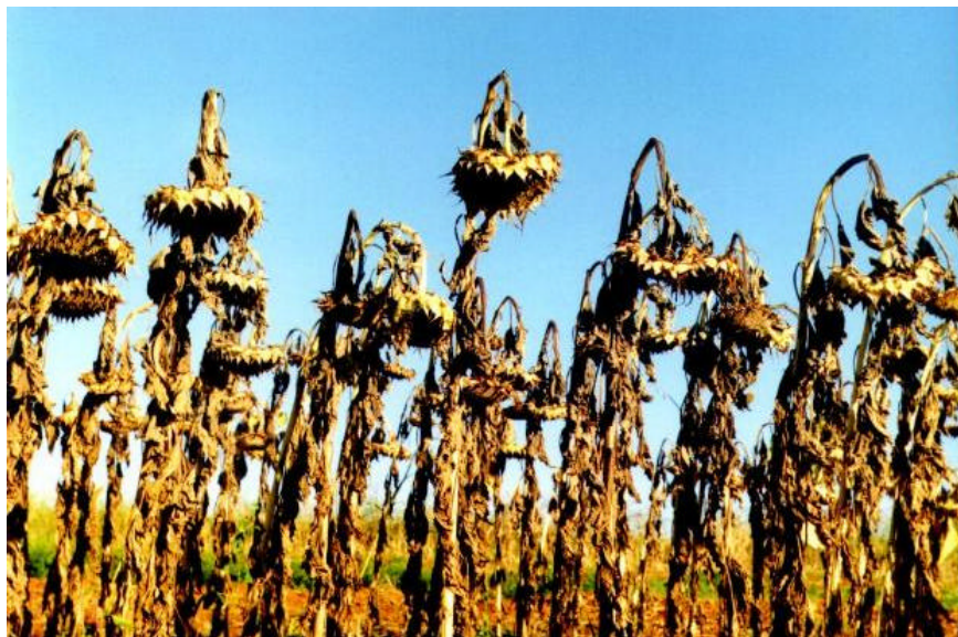
Fig. 4. Plantas de girassol em estágio de desenvolvimento adequado para ensilagem.

modificadas da parte externa do capítulo) estão com coloração amarelo-castanho e a maior parte das folhas presas ao caule já está seca (Fig. 4). Quando a colheita é efetuada antes da maturação fisiológica dos aquênios, o girassol contém alta quantidade de água, o que prejudica a fermentação. Por sua vez, quando é ensilado tardiamente, tem produzido silagens com altas proporções de componentes da parede celular e baixos coeficientes de digestibilidade, portando, de menor valor nutritivo.