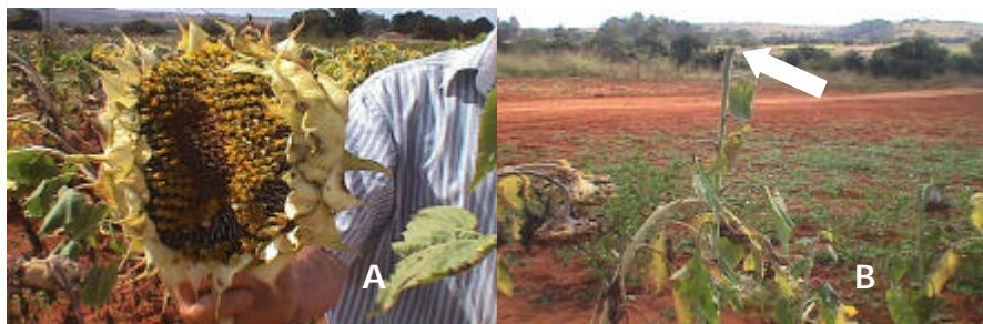
Fig. 1. Plantas de girassol com sintomas de deficiência de boro, com deformação do capítulo (A) e perda de capítulo (B).

O girassol possui características que dificultam a absorção de boro, sendo sensível aos baixos níveis desse elemento no solo. Por esse motivo apresenta, com frequência, nas principais regiões agrícolas do país, sintomas de deficiência, principalmente nas fases de florescimento e de maturação (Castro et al., 1997). Capítulos pequenos e deformados e a perda de capítulos (Fig. 1) são alguns dos sintomas característicos dessa deficiência.