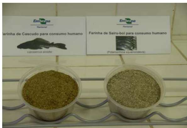
Figura 2. Farinhas de cascudo (à esquerda) e de sairu-boi (à direita).

Após estes procedimentos é feita a trituração com adição de um antioxidante (BHT, butilhidroxitolueno) para evitar que a farinha fique rançosa. Após a trituração é feita a secagem a 140°C, nova trituração e enfim a peneiragem. Quanto mais fina a peneira melhor, pois mais uniforme e vistosa ficará a farinha. E está pronto o produto que pode ser usado para empanar, engrossar sopas ou na elaboração de outros diversos produtos.