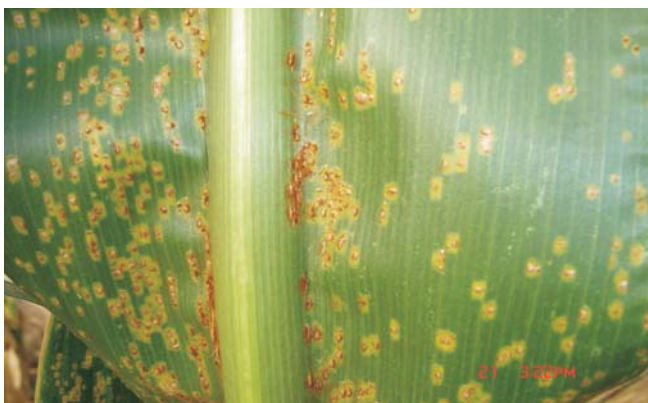
Figura 4. Ferrugem comum ( Puccinia sorghi )

Sintomas: As pústulas são formadas na parte aérea da planta e são mais abundantes nas folhas. Em contraste com a ferrugem polissora, as pústulas são formadas em ambas as superfícies da folha, apresentam formato circular a alongado e se rompem rapidamente (Figura 4).