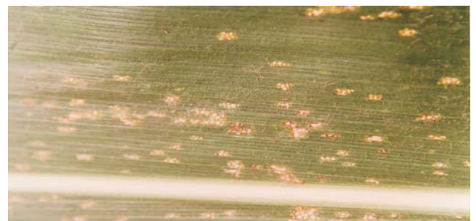
Figura 5. Ferrugem branca ( Physopella zaeae )

Sintomas: Pústulas brancas ou amareladas, em pequenos grupos, de 0,3 a 1,0mm de comprimento na superfície superior da folha, paralelamente às nervuras (Figura 5).