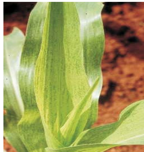
Figura 14. Mosaico comum

Sintomas: Os sintomas caracterizam-se pela formação nas folhas de manchas verde claro com áreas verde normal, dando um aspecto de mosaico (Figura 14). As plantas doentes são, normalmente, menores em altura e em tamanho de espigas e de grãos.