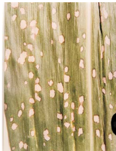
Figura 2. Mancha branca ( Pantoea ananas )

Sintomas: As lesões iniciais apresentam um aspecto de encharcamento (anasarca), tornando-se necróticas com coloração palha de formato circular a oval com 0,3 a 2cm de diâmetro. Há coalescência de lesões em ataques mais severos (Figura 2).