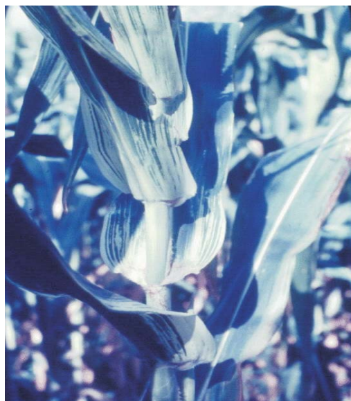
Figura 15: Enfezamento pálido

enfezamento vermelho é causado por procarionte pertencente ao gênero Phytoplasma denominado pelo nome comum fitoplasma.