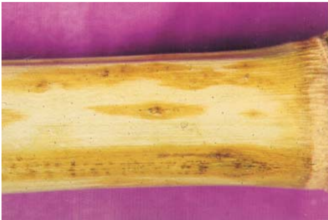
Figura 9. Antracnose do colmo ( Colletotrichum graminicola )

respingos de chuva. A infecção do colmo pode ocorrer pelo ponto de junção das folhas com o colmo ou através de raízes. A antracnose é favorecida por longos períodos de altas temperaturas e umidade, principalmente na fase de plântula e após o florescimento.