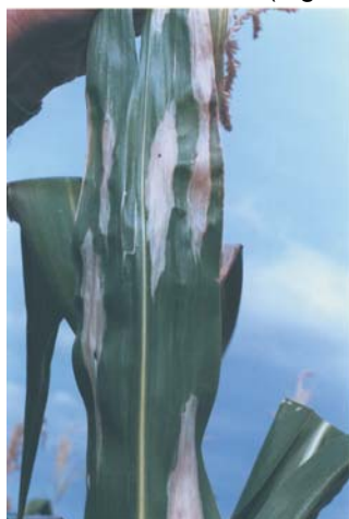
Figura 6. Helmintosporiose ( E. turcicum )

Sintomas: Os sintomas característicos são lesões alongadas, elípticas, de coloração cinza ou marrom e comprimento variável entre 2,5 a 15cm. A doença ocorre inicialmente nas folhas inferiores (Figura 6).