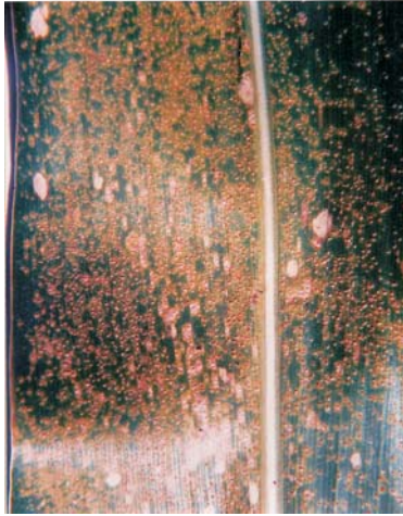
Figura 3. Ferrugem polissora ( Puccinia polysora )

Epidemiologia: A ocorrência da doença é dependente da altitude, ocorrendo com maior intensidade em altitudes abaixo de 700m. Altitudes acima de 1200m são desfavoráveis ao desenvolvimento da doença.