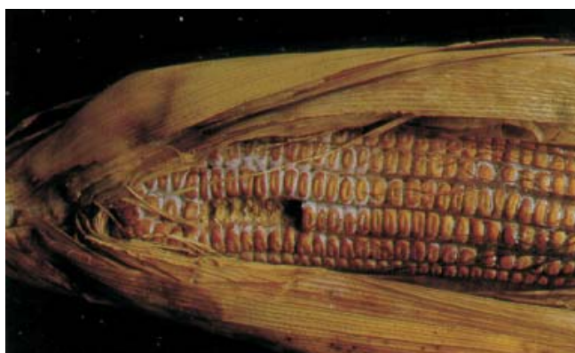
Figura 17. podridão da espiga causada por Stenocarpella sp

mais suscetíveis. A alta precipitação pluviométrica na época da maturação dos grãos favorece o aparecimento dessa doença. A evolução da podridão praticamente cessa quando o teor de umidade dos grãos atinge 21 a 22% em base úmida. O manejo integrado para o controle desta podridão de espiga envolve a utilização de cultivares resistentes; de sementes livres dos patógenos; da destruição de restos culturais de milho infectados; e da rotação de culturas, visto que o milho é o único hospedeiro desses patógenos.