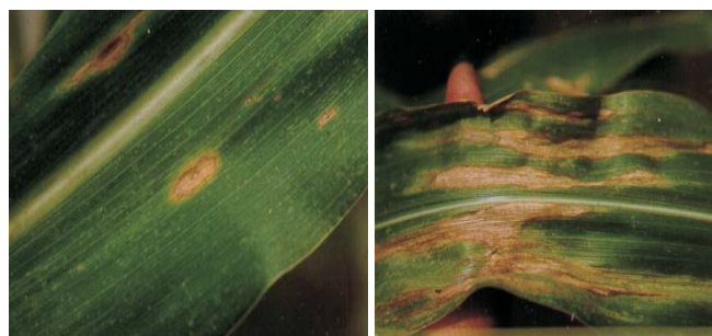
Figura 7. Mancha de diplodia ( Stenocarpella macrospora )

Sintomas: As lesões são alongadas, grandes, semelhantes as de H. turcicum . Diferem desta por apresentar, em algum local da lesão, pequeno círculo visível contra a luz (ponto de infecção). Podem alcançar até 10 cm de comprimento (Figura 7).