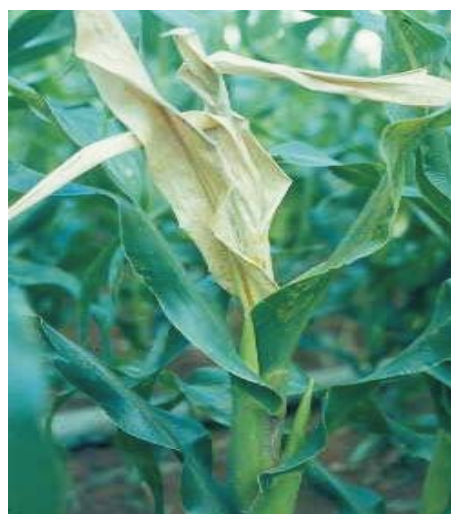
Figura 12. Podridão bacteriana

Essas podridões podem também se iniciar pela parte superior do colmo, causando a “podridão do cartucho por Erwinia ”. Os sintomas típicos dessa doença são a murcha e a seca das folhas do cartucho decorrentes de uma podridão aquosa na base desse cartucho. As folhas se desprendem facilmente e exalam um odor desagradável. Na bainha das outras folhas, pode-se observar a presença de lesões encharcadas (anasarcas). Pode ocorrer o apodrecimento dos entrenós inferiores ao cartucho e a murcha do restante da planta. Ferimentos no cartucho causados por insetos podem favorecer a incidência dessa podridão.