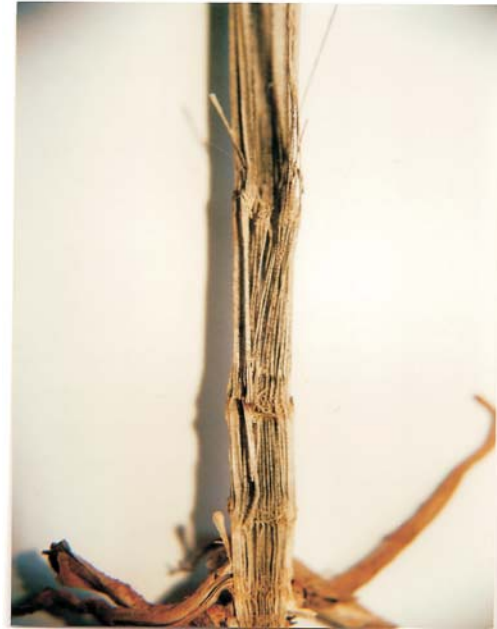
Figura 10. Podridão seca ( Macrophomina phaseolina )

sobre os quais é possível observar a presença de numerosos pontinhos negros que conferem internamente ao colmo uma cor cinza típica (Figura 10).