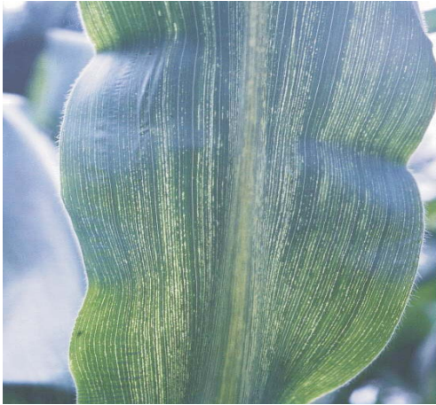
Figura 13. Raiado fino

Sintomas: Os sintomas característicos são riscas formadas por numerosos pontos cloróticos coalescentes ao longo das nervuras, que são facilmente observados quando as folhas são colocadas contra a luz (Figura 13).