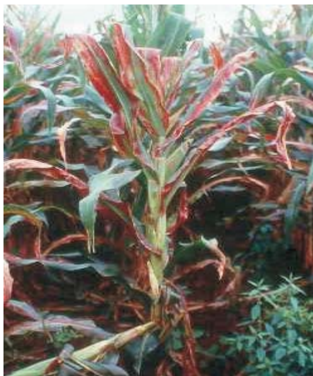
Figura 16. Enfezamento vermelho

Epidemiologia: Molicutes Spiroplasma e Phytoplasma ocorrem somente em células do floema de plantas doentes de milho e são transmitidos de forma persistente propagativa pela cigarrinha Dalbulus maidis que, ao se alimentar em plantas doentes, adquire os