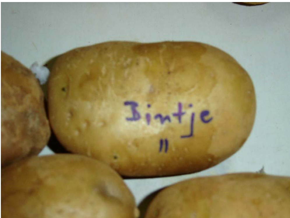
Fig. 2. Esverdeamento da cultivar Bintje, aos 10 dias após exposição à luz.