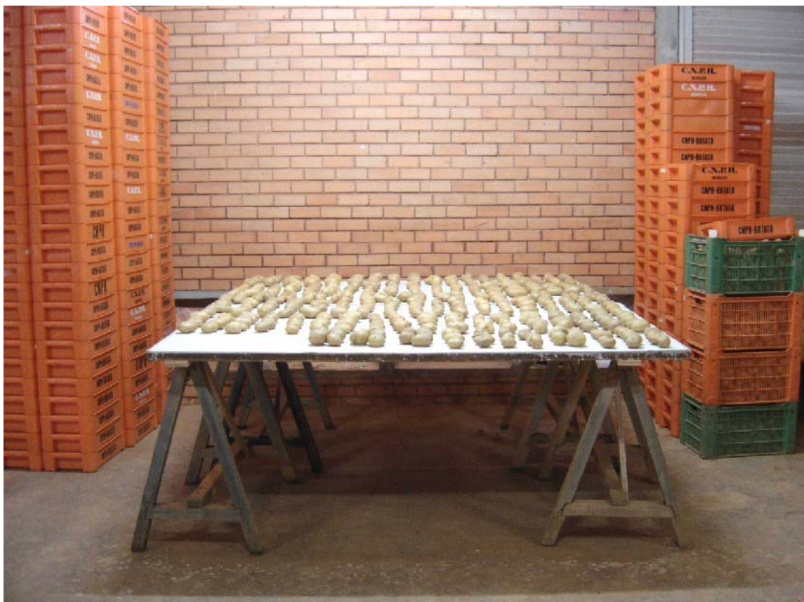
Fig. 3. Exposição de tubérculos à luz.

A avaliação da tolerância ao esverdeamento baseada apenas na velocidade de esverdeamento é arriscada. Isso porque alguns genótipos que apresentaram esverdeamento ausente após cinco dias de exposição à luz, como, por exemplo, EH 1033-01 e EH 1033-01, evoluíram para esverdeamento médio ao final do experimento ( Tabela 1 ). Situação ainda mais crítica é a de genótipos como EH 803-01 e CGC 1527-08, que, agrupados junto à cultivar Bintje, tolerante ao esverdeamento, no início do experimento, chegaram a 20 dias de avaliação com tubérculos apresentando esverdeamento muito forte, na mesma classe da cultivar Achat, suscetível ao esverdeamento ( Tabela 1 ). Porém, como alguns genótipos mostraram esverdeamento muito rápido, a avaliação precoce pode ser bastante útil na fase inicial dos programas de melhoramento, quando há muitos genótipos a serem avaliados e pretende-se, sobretudo, descartar aqueles menos promissores.