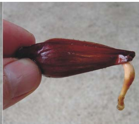
Figura 4. Sementes pré-germinadas de araucária.