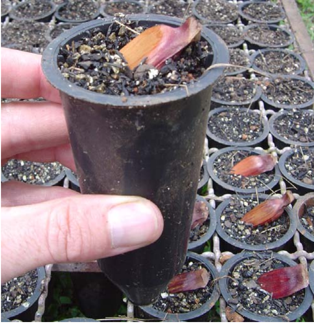
Figura 3. Forma de colocação da semente no substrato.

Caso a semente seja colocada totalmente dentro do substrato, deve-se observar para que fique deitada. A camada de substrato por cima da semente não deverá ultrapassar uma vez a altura da semente deitada.