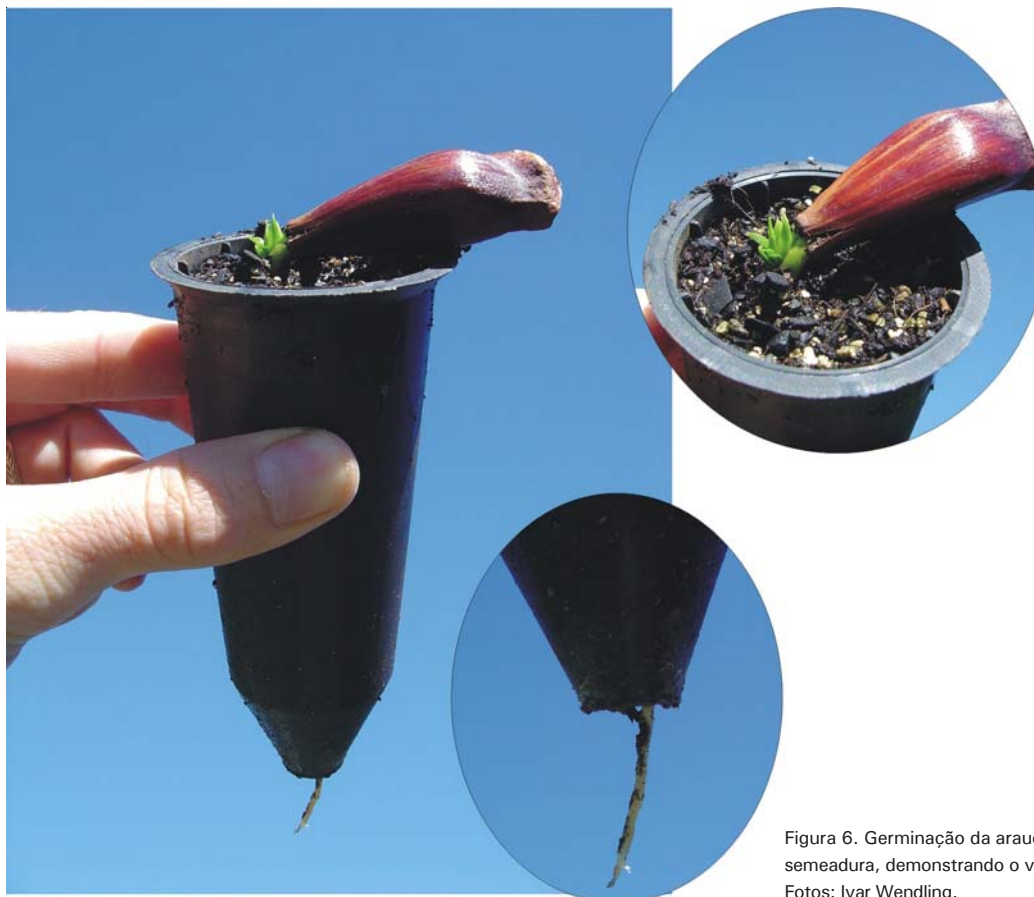
Figura 6. Germinação da araucária, 20 dias após a semeadura, demonstrando o vigor da raiz.

É normal que mesmo a semente não tendo emitido parte aérea, a emissão da raiz já tenha ocorrido. A araucária emite primeiramente a parte radicular e, posteriormente, a parte aérea (Figura 6).