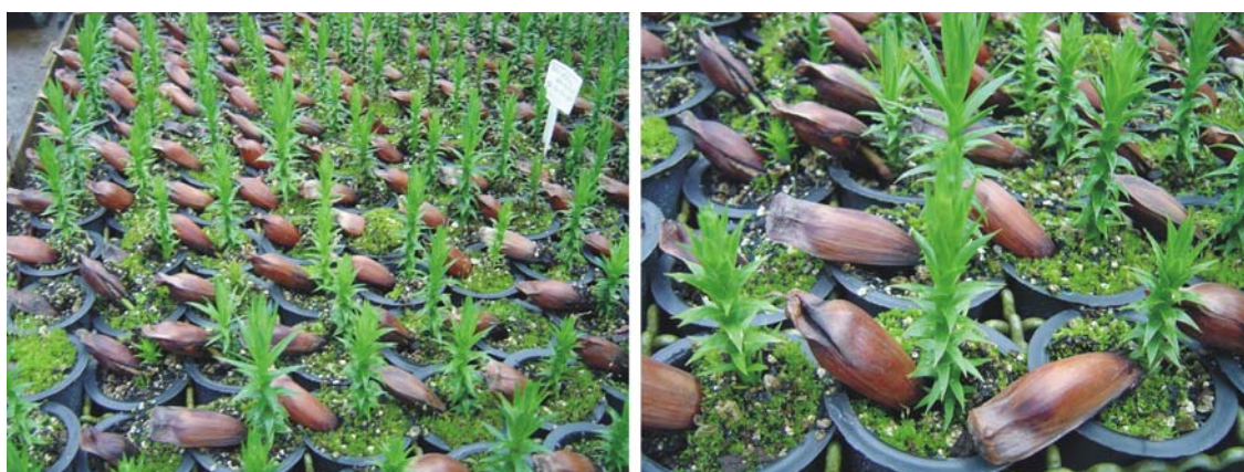
Figura 7. Sementes de araucária 90 dias após a semeadura.

Em torno de 50 a 90 dias após a semeadura (Figura 7), as mudas se encontram ao redor de 1 cm a 2 cm de altura e, aos 3 meses, com altura ao redor de 5 cm a 8 cm.