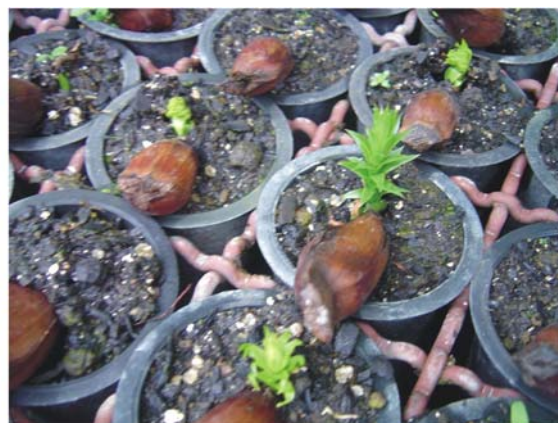
Figura 5. Sementes de araucária 45 dias após a sementeira.