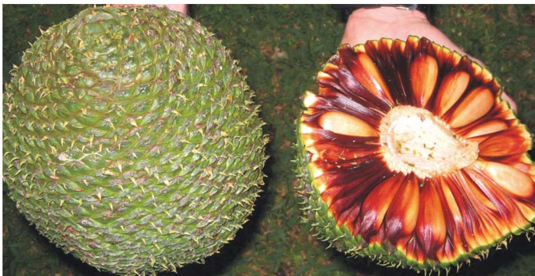
Figura 1. Pinha de araucária fechada (à esquerda) e aberta (à direita) mostrando os pinhões.

Antes de serem semeadas, é interessante colocar as sementes em um recipiente com água (Figura 2) e verificar quais irão boiar; as que boiarem estão estragadas e não servem para a semeadura; já as que ficarem no fundo podem ser usadas, uma vez que se apresentam com bom poder germinativo.