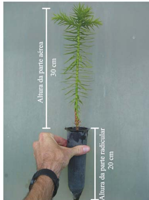
Figura 8. Mudanças de araucária prontas para plantio a campo.

Quando as mudas forem produzidas em ambiente sombreado, em torno de 30 dias antes do plantio a campo, estas devem sofrer o processo de rustificação, ou seja, serem preparadas para as condições mais drásticas de campo a que serão submetidas após o plantio definitivo. Esta rustificação obrigatoriamente deverá ser feita a pleno sol, onde o número e a frequência de irrigações deverão ser diminuídos.