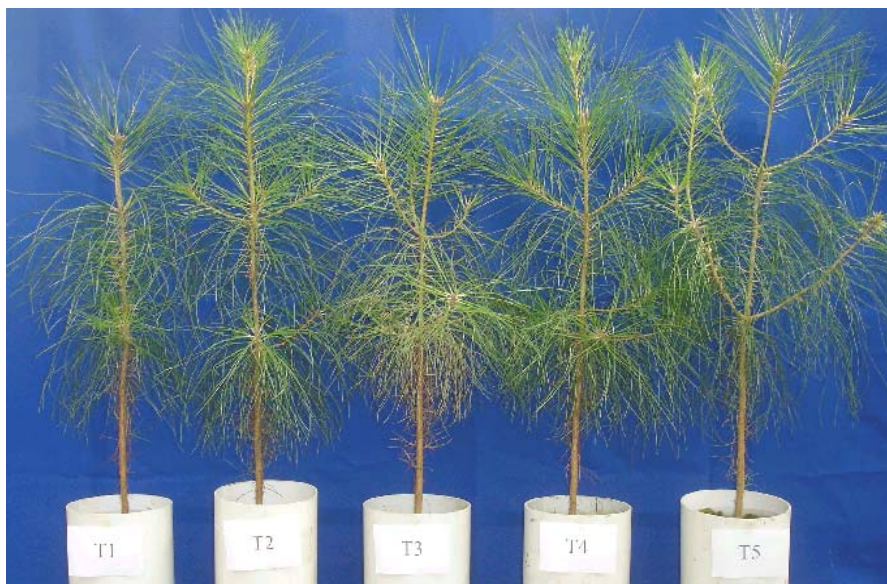
Figura 2. Plantas de Pinus taeda nos diferentes tratamentos do ensaio.