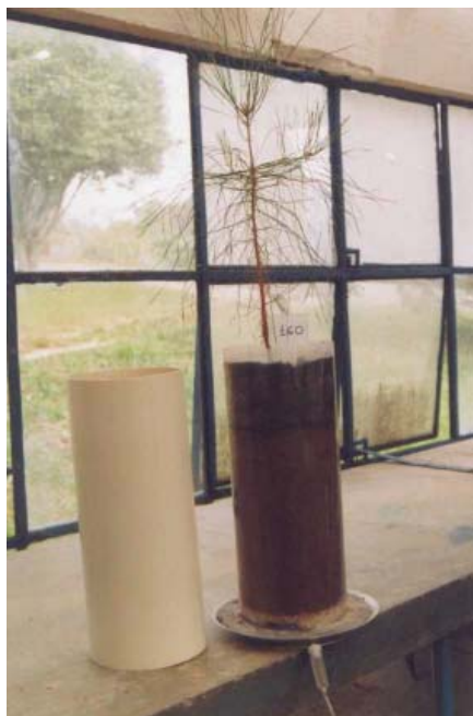
Figura 1. Ilustração de vaso com dispositivo para visualização das raízes e para coleta de água de percolação.

A avaliação final do ensaio foi realizada em 27 de fevereiro de 2007. Coletou-se a parte aérea cortando as mudas ao nível do solo. Após a coleta da biomassa, procedeu-se a percolação de água em volume suficiente para a coleta de 2 L de água, a qual foi analisada para determinação de elementos químicos lixiviados. Em seguida, amostras de solo foram coletadas das profundidades 0 a 10 cm, 10 cm a 20 cm e 20 cm a 30 cm. Posteriormente foram coletadas as raízes para avaliação de suas biomassas secas.