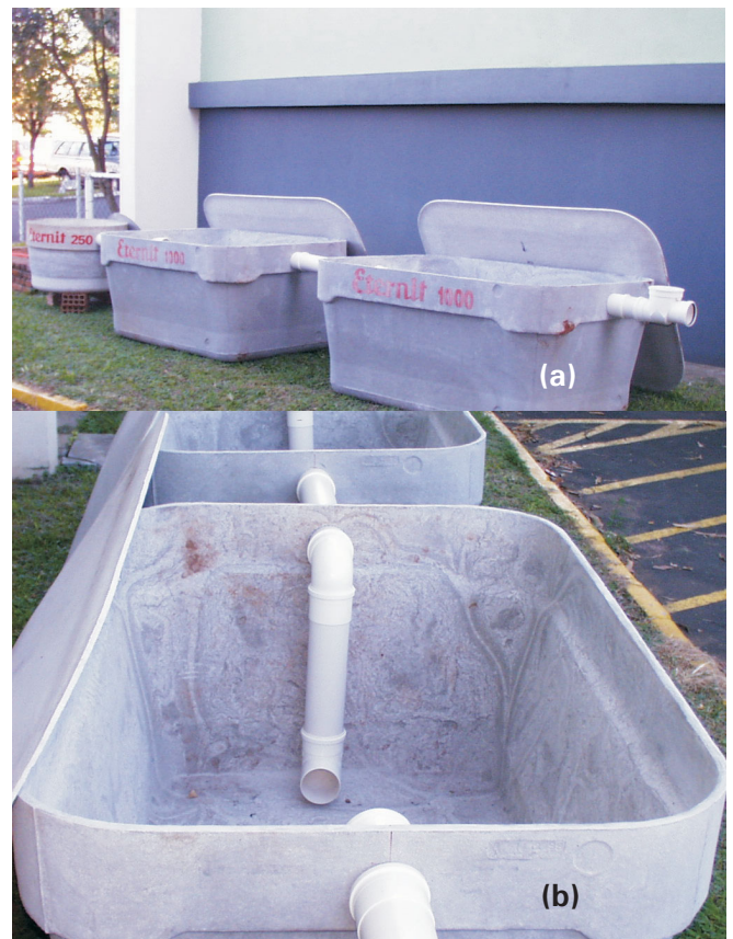
Figura 2 Foto de um biodigestor montado. a) vista lateral e b) vista superior.

A figura 2 mostra a foto de um sistema montado.