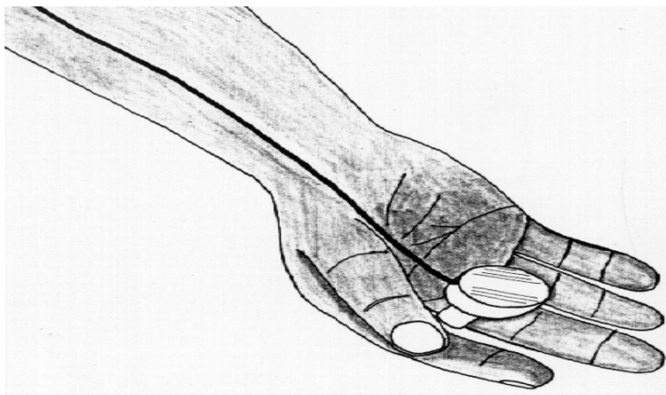
Fig. 1 - Transdutor ultra-sônico preso no dedo médio

5-Recomenda-se um breve treinamento do perito com o uso do aparelho, para acostumar o ouvido com os sons equivalentes aos batimentos cardíacos fetais emitidos pelo altofalante.