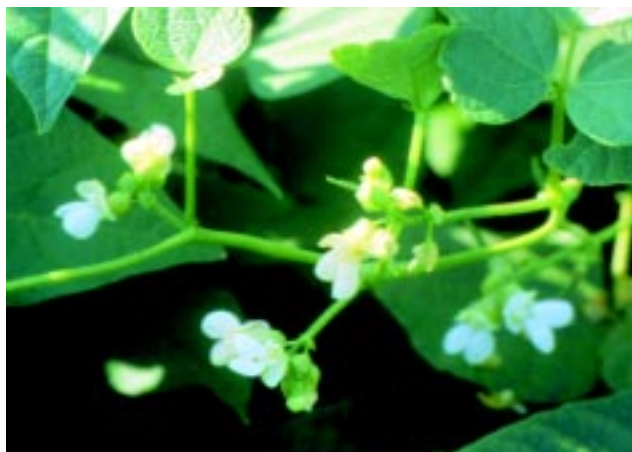
Fig. 2. Flores da cultivar BRSMG Talismã.