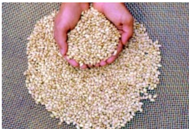
Fig. 1. Grãos da cultivar BRSMG Talismã.

prostrado; flor de cor branca; vagem amarelo-areia na maturação; semente com brilho intermediário; e massa média de 100 sementes de 26,5 g (Figuras 1, 2 e 3). Apresenta, como vantagens, resistência ao mosaico comum, à antracnose (patótipos 65 e 89), reação intermediária à mancha angular, grãos claros, tempo de cocção inferior a 30 minutos e alto potencial produtivo. Na Figura 4, é apresentada a produtividade média da BRSMG Talismã em 17 ambientes em Minas Gerais, nas safras “das águas”, “seca” e outono-inverno, em comparação com as cultivares Carioca e Pérola. Na média dos 17 ambientes, ela superou essas cultivares em 10%.