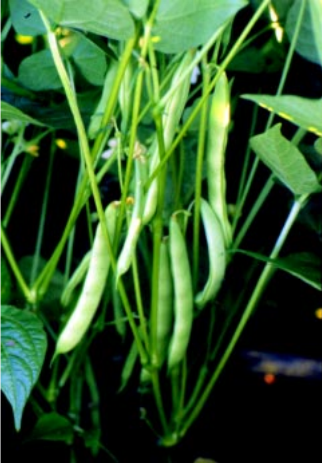
Fig 3. Vagens da "BRSMG Talismã".