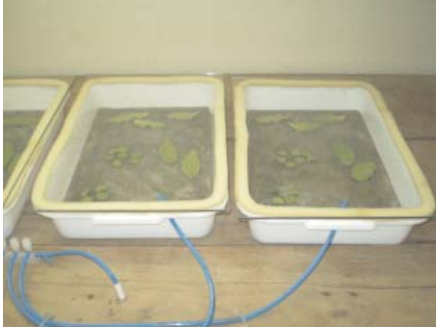
Fig. 6. Detalhe das mangueiras dosadoras de CO 2 para o interior das bandejas contendo folhas com doenças.