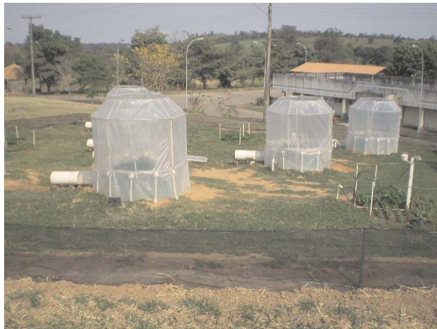
Fig. 2. Vista geral das câmaras de topo aberto