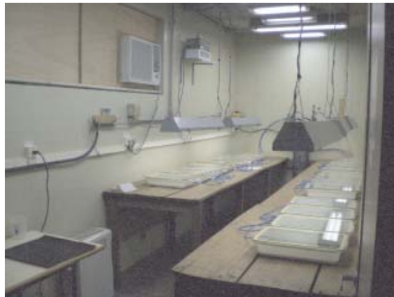
Fig. 5. Sala climatizada para estudos com temperatura e umidade controlada