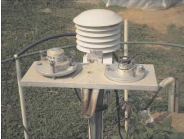
Fig. 4. Sensor acoplado ao sistema de dosagem de CO 2 das câmaras de topo aberto