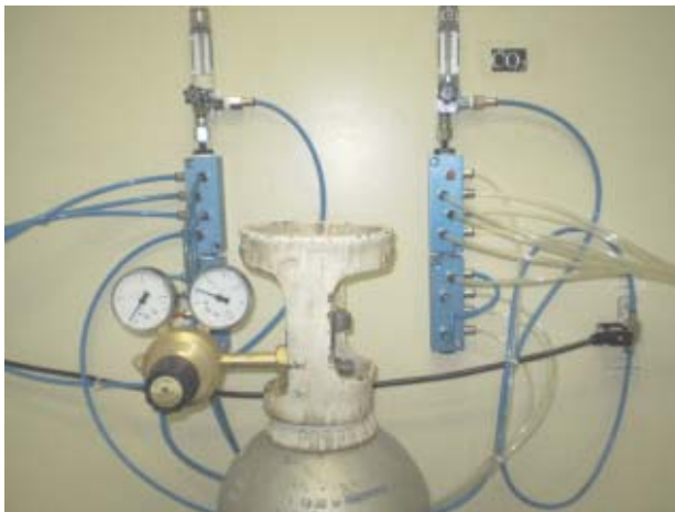
Fig. 7. Cilindro de CO 2 com os ramais (mangueiras) de saída para as bandejas.

preliminares de pesquisas sobre mudanças climáticas globais. Durante essa apresentação foram, apontados também, outros dois equipamentos que podem ser utilizados para esses estudos: o fitotron e o F.A.C.E (Free Air CO 2 Enrichment).