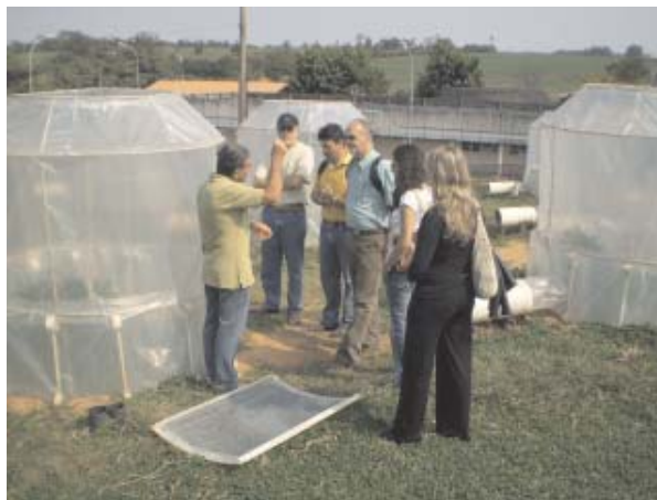
Fig. 1. Técnico da Embrapa Meio Ambiente explicando a metodologia de trabalho com as câmaras de topo aberto

utilizadas para os estudos de avaliação do aumento da concentração de \text{CO}_2 e seus efeitos sobre cultivos agrícolas. Pôde-se observar que o investimento inicial para se começarem os trabalhos básicos de estudos de mudanças climáticas é relativamente pequeno. Observaram-se as câmaras de topo aberto (Fig. 1, 2, 3, 3.1 e 4) que servem para estudar os efeitos de doenças, pragas e plantas daninhas em condições de aumento na concentração de \text{CO}_2 . E uma câmara climatizada (Fig. 5, 6 e 7), onde estudos com simulação de aumento da concentração de \text{CO}_2 e de temperatura podem ser realizados com respostas satisfatórias em etapas