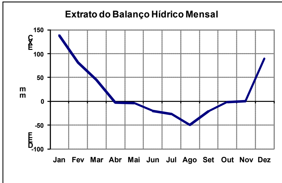
Figura 2. Representação gráfica do balanço hídrico (Thorntwaite e Mather, 1955) para o município de Pedro Gomes, MS.