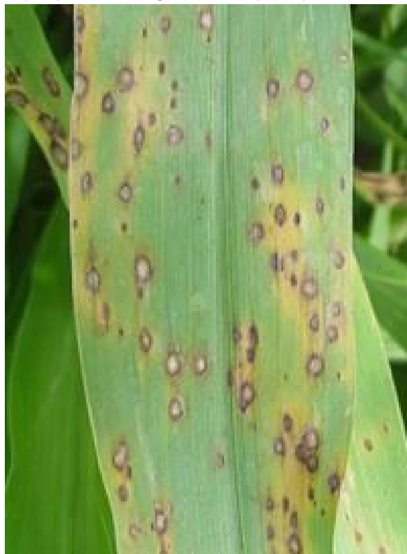
Fig. 4. Mancha de Pyricularia ( Pyricularia grisea ).

http://pubs.caes.uga.edu/caespubs/pubcd/B1216/B1216.htm