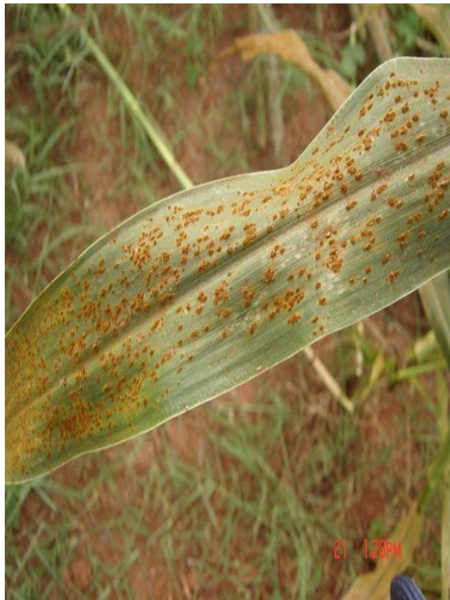
Fig. 3. Ferrugem do Milheto ( Puccinia substriata var. penicillariae ).