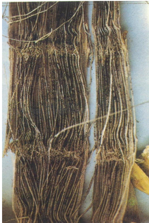
Fig. 6. Podridão seca do colmo em milho ( Macrophomina phaseolina ).

Foto: Williams, RJ, Frederiksen, RA, Girard, JC. Sorghum and pearl millet disease identification handbook. Hyderabad: ICRISAT. 88p. 1978.