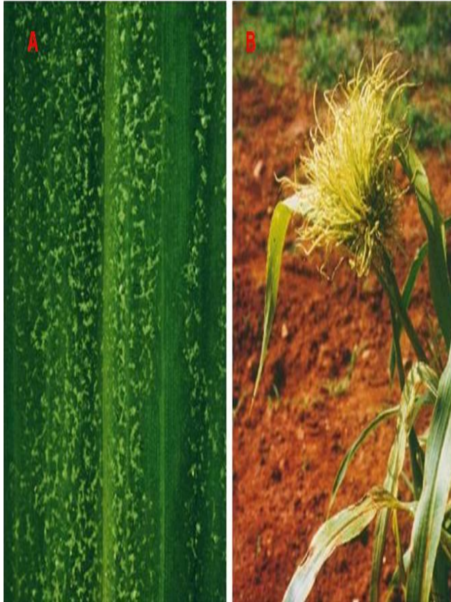
Fig. 2. Sintomas míldio localizado (A) e sistêmico (B) do milheto.