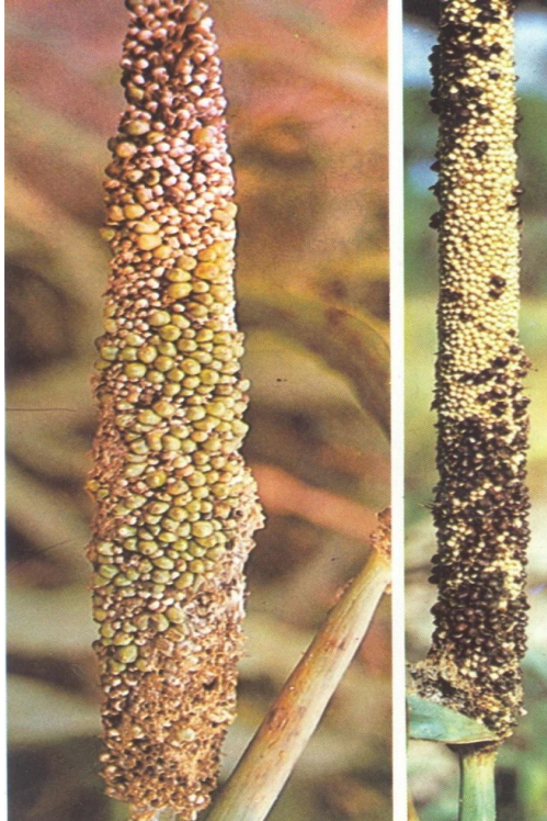
Fig. 5. Carvão do milheto ( Moesziomyces penicillariae (Bref.) Vanky).