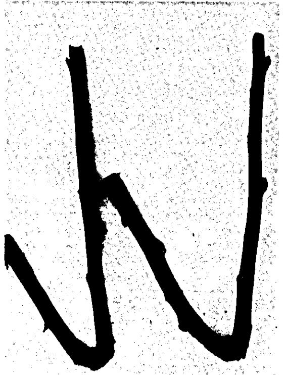
FIG. 1. Ramo dobrado após ser retirado da planta, mostrando a cicatrização no local da dobra.

As estacas obtidas de ramos dobrados tinham 25 cm de comprimento e diâmetro médio de 11,5 mm e 9,8 gemas. Na base dessas estacas foi aproveitado o tecido cicatricial (Fig. 1 e 2), enquanto as estacas de ramos não dobrados, com 25 cm de comprimento, apresentavam um diâmetro médio de 7,1 mm e 8,4 gemas (Fig. 3).