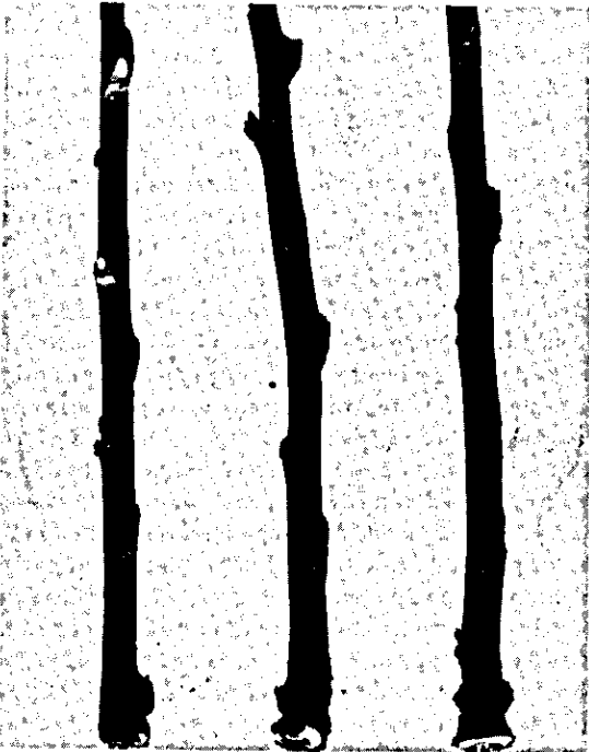
FIG. 2. Estacas de ramos dobrados de pessegueiro, apresentando na base o tecido formado no local da dobra.