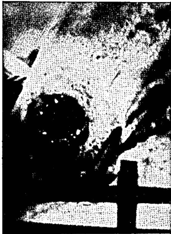
FIG. 1. Lesão micótica proliferativa da ala nasal.

A lesão nasal (Fig. 1) era de caráter proliferativo e teve evolução de três meses, com comprometimento do tabique nasal e projeção externa de 2 cm; lesões comparáveis a esta foram observadas em outros equídeos da região.