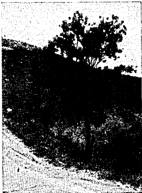
FIG. 1. Uma árvore de Sessea brasiliensis Toledo no pasto. Município de Pindamonhangaba, Estado de São Paulo.

outras ocasiões, e observações próprias revelaram alguns aspectos interessantes sobre S. brasiliensis (Fig. 1), não relatados por Andrade (1960), e motivo desta publicação.