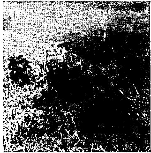
FIG. 2. Brotação de Sessea brasiliensis . Fazenda S. M., Pindamonhangaba, São Paulo.

Informa ainda que o gado pode comer sem perigo, a brotação saída de tocos de árvores cortadas, porém, o brôto cortado e murcho é perigoso.