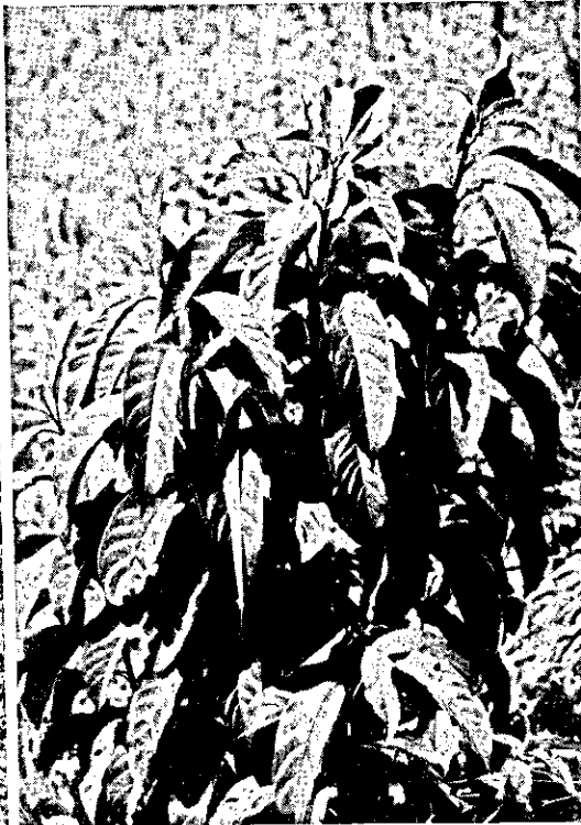
FIG. 3. Um pé cortado de S. brasiliensis com brotação. Faz. H., Pindamonhangaba, São Paulo.