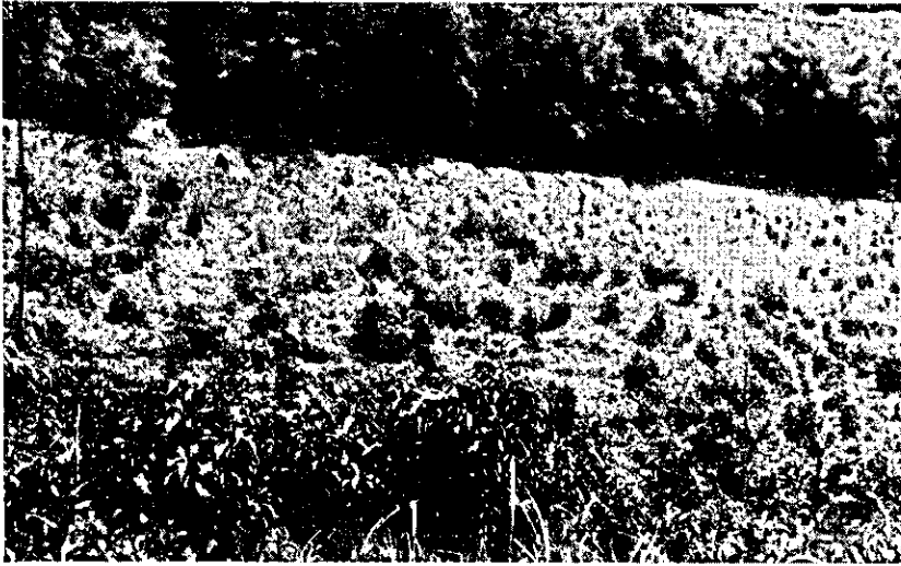
FIG. 5. Pasto com numerosos pés de S. brasiliensis cortados, em plena brotação. Faz. H., Pindamonhangaba, São Paulo.

diminuição do apetite, e em 19.9.65 uma ligeira sensibilidade da área hepática à percussão, e diminuição dos movimentos do rúmen.