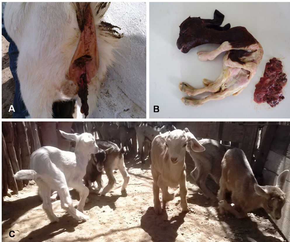
Fig.3. Intoxicação por Poincianella pyramidalis (Tul.) L.P. Queiroz (= Caesalpinia pyramidalis Tul.) em caprinos. (A) Cabra Saanen apresentando retenção de placenta, associada a corrimento vermelho-escuro, quatro dias após abortar um caprino acometido por malformações. (B) Placenta e feto de caprino Boer acometido por artrogripose. Nota-se flexão permanente dos membros torácicos e hipertensão dos membros pélvicos. (C) Rebanho de caprinos mestiços acometidos por artrogripose dos membros torácicos.