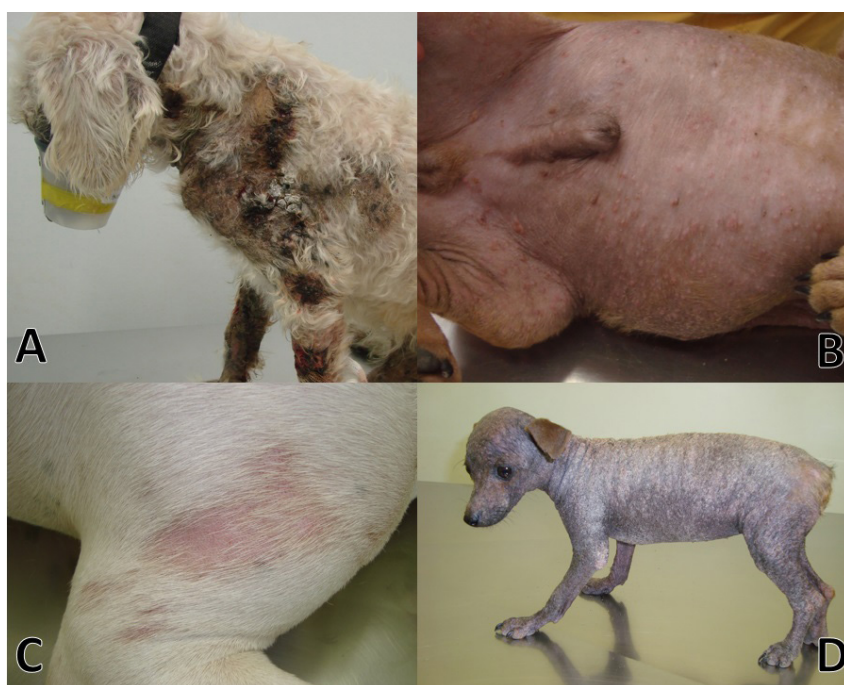
Fig.1. Aspectos clínicos em caninos com demodicose . (A) Canino macho, 8 anos, com demodicose generalizada, apresentando lesões crostosas na região escapular e em membros anteriores. (B) Canino macho, 6 meses, com demodicose generalizada, apresentando pápulas e pústulas na região ventral. (C) Canino fêmea, 1 ano, com demodicose localizada, apresentando alopecia e eritema na região escapular direita. (D) Canino fêmea, 4 meses, com demodicose generalizada, apresentando alopecia total, descamação e hiperpigmentação.

Na derme, apenas dois cães (4,3%) não demonstraram processos inflamatórios, de forma que nos cães com inflamação dermal, exsudato predominantemente linfoplasmocitário foi o de maior ocorrência (n=22; 47,8%), seguido pelo exsudato linfohistioplasmocitário e neutrofílico (n=21; 45,6%) e apenas um caso com infiltrado inflamatório neutrofílico (2,2%). Intensidade variável de seções de artrópodes de exoesqueleto quitinoso com parede delgada e eosinofílica, contendo segmentos pontuais basofílicos no interior, de morfologia compatível com Demodex sp. puderam ser observados preenchendo e expandindo o lúmen de folículos pilosos de 39 cães (84,8%). Os achados morfológicos frequentes foram