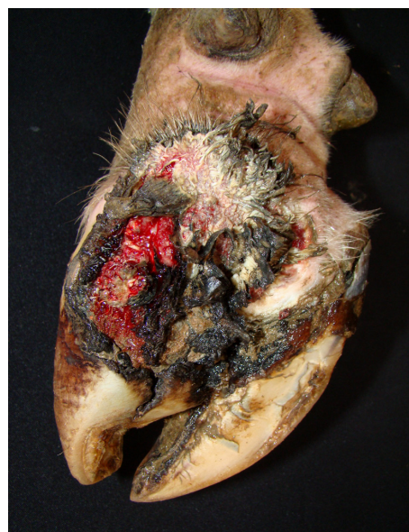
Fig.5. Dermatite digital. Perda de tecido córneo dos talões, sola e muralha abaxial do dígito com presença de pelos longos e espículas de cor variando de enegrecida a branca.