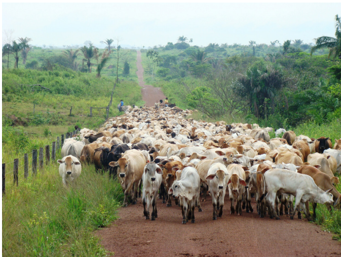
Fig.2. Manejo animal inadequado de bovinos de corte criados na região sudeste do Pará. Lote de fêmeas e bezerras sendo conduzidos ao centro de manejo, percorrendo longas distâncias por vias de acesso pavimentadas com cascalho, para procedimentos reprodutivos.

Nos currais, na tentativa de acelerar os procedimentos, os bovinos eram estimulados pelos tratadores com choques elétricos, fortes pancadas e objetos pontiagudos o que aumentava o estresse e agressividade dos animais.