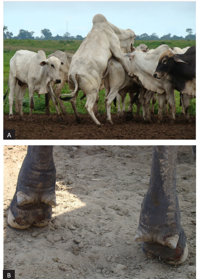
Fig.3. Abrasão de talão. (A) Bovinos machos, Nelore, não castrado realizando sodomia. (B) Erosões no tecido córneo dos talões, na base da sobreunha, quartela e coroa dos membros pélvicos em consequência da sodomia.

Distúrbios de comportamento entre bovinos, como o homossexual (sodomia) foi relatado em todas as propriedades estudadas, principalmente em lotes de animais mestiços de Europeu-Nelore não castrados (Fig.3). Nenhuma das fazendas adotava medidas profiláticas relacionadas às afecções podais. Porém, 16,7% (2/12) das propriedades utilizavam pedilúvio, com solução de formol e sulfato de cobre, para auxiliar na recuperação de animais tratados. Nessas fazendas, os procedimentos terapêuticos, com