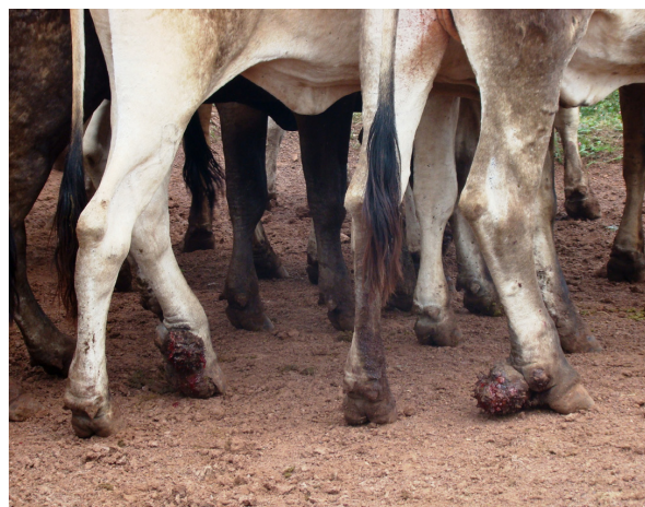
Fig.4. Pododermatite da sobreunha. Bovinos com perda de tecido córneo e proliferação acentuada de tecido de granulação nas sobreunhas dos membros pélvicos.

O espaço interdígital foi mais afetado nas fêmeas, tanto nos membros torácicos com 9,15% quanto nos membros pélvicos com 6,5% das lesões. Nos machos essa região do dígito foi bem menos afetada com 1,89% nos membros torácicos e 1,73% nos membros pélvicos.