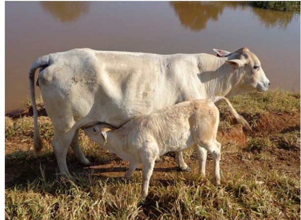
Fig.4. (A) Imagem demonstrando a possível ingestão de oocistos esporulados por meio de água contaminada, no pasto onde os surtos ocorreram. (B) Bezerro amamentando demonstrando possivelmente a ingestão de oocistos esporulados que por ventura se aderiram nas tetas das vacas.

da infecção, em criações extensivas, as áreas onde acumulam a água das chuvas (cacimbas), utilizadas como bebedouros pelos animais, também podem servir como fonte de infecção para oocistos de Eimeria spp. No presente estudo, é importante destacar que a água para os animais beberem era proveniente de nascentes que eram represadas para haver a formação de lagoas no pasto. Em função da idade dos bezerros deste estudo se alimentarem de leite materno (Vaz et al. 2011) e água, muito provavelmente a infecção destes animais por Eimeria spp. aconteceu por meio da ingestão de água diretamente, ou, indiretamente, quando, por ventura, oocistos esporulados se aderiram nas tetas das vacas, quando estas adentraram estas lagoas para beberem água, e quando os bezerros foram amamentar acabaram ingerindo a forma infectante deste protozoário (Fig.4AB).