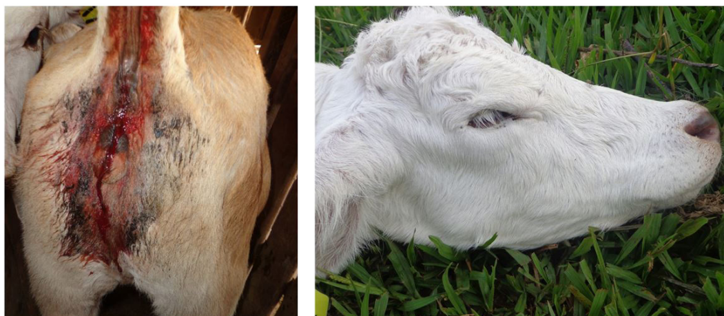
Fig.1. (A) Bezerro apresentando diarreia sanguinolenta desencadeada pelo elevado parasitismo por Eimeria spp. (OoPG 61.550; 99% de parasitismo por Eimeria zuernii ). (B) Bezerro desidratado, diagnosticado por meio da profundidade do globo ocular.

a Médias seguidas pela mesma letra maiúscula na linha, não diferem entre si ( P > 0,05 ), b Probabilidade de significância do Teste.