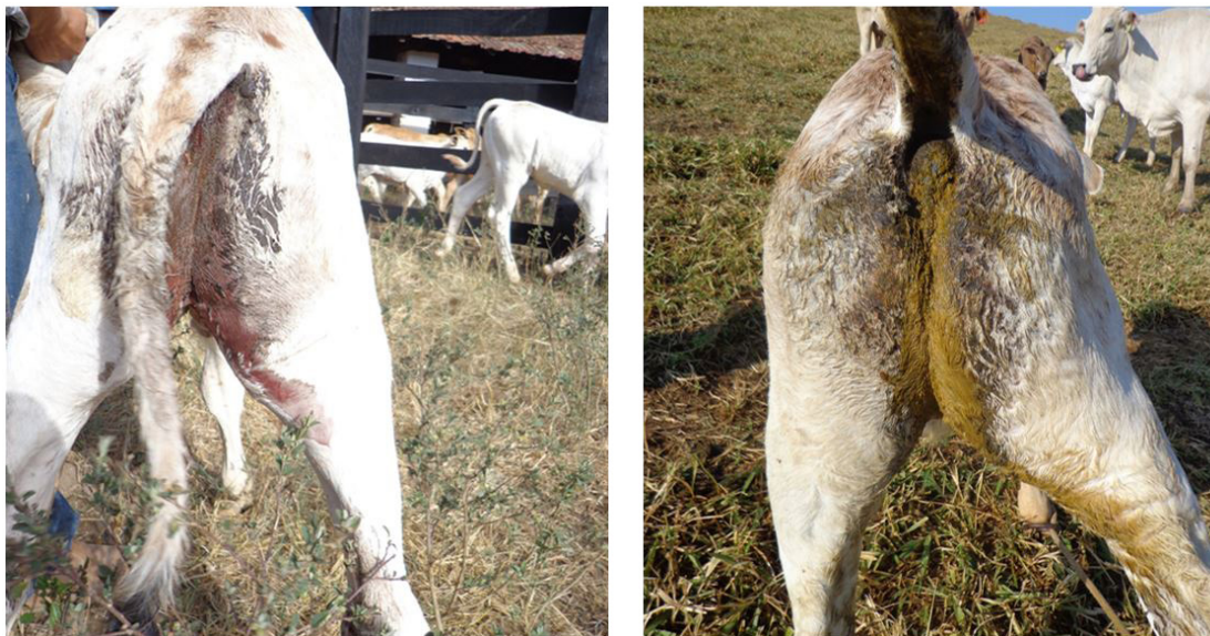
Fig.3. (A) Bezerro com diarreia sanguinolenta antes do tratamento com toltrazuril 15mg/kg. (B) Mesmo bezerro com diarreia (sem a presença de sangue) 3 dias após o tratamento com toltrazuril 15mg/kg.