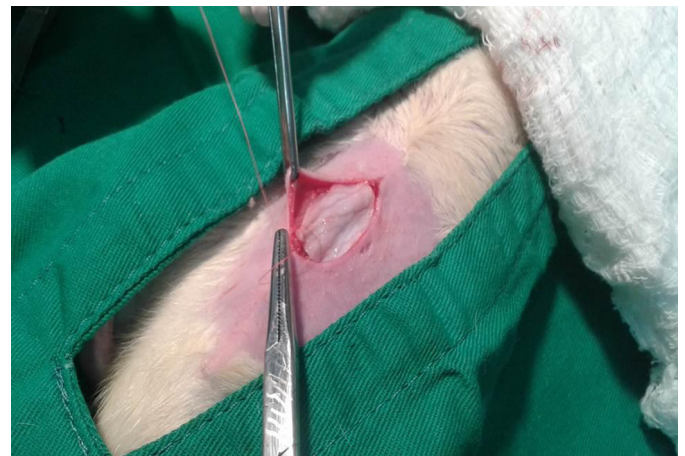
Fig.1. Procedimento cirúrgico para aplicação de túnica albugínea ovina como reforço de parede abdominal de ratos. UFF, 2015.

Avaliação microscópica. Foram avaliados subjetivamente pelo mesmo observador os seguintes parâmetros: infiltrado in-