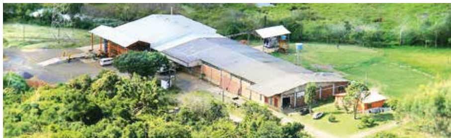
Figura 3. Sede da Ecocitrus.