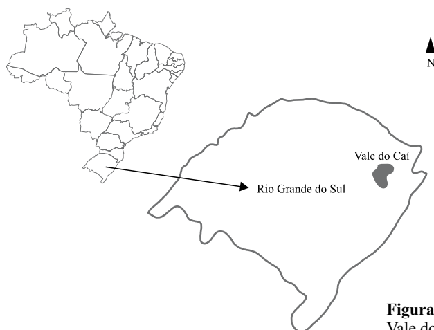
Figura 2. Localização da Ecocitrus – Vale do Caí.

cooperativa. A Usina de Compostagem de Resíduos Agroindustriais teve início em 1995, após algumas tentativas dos primeiros associados da Ecocitrus de encontrar uma solução de adubação orgânica para os seus pomares, em substituição ao uso de agrotóxicos. Perceberam que a criação de uma usina própria conseguiria fornecer um composto totalmente orgânico, sendo a melhor decisão com benefícios não somente para eles, mas também para toda a região, além de gerar menos custos financeiros para as propriedades cooperadas.