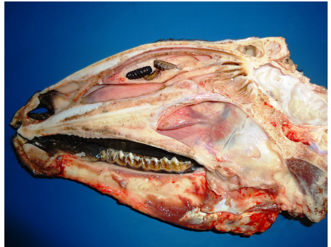
Fig.3. Conchas nasais com hiperemia e presença de larvas de Oestrus ovis .

A média mensal da temperatura mínima, umidade relativa do ar e chuvas acumuladas nos municípios durante os quatro anos estão representadas nas Figs 2A-C. A média mensal das chuvas acumuladas, no período do estudo, no município de Cruz das Almas foi de 89,58mm, em São Gonçalo dos Campos e Serrinha essa média apresentou uma variação chegando a 48,56mm e 49,23mm, respectivamente. Apenas houve diferença estatística significativa ( p < 0,001 ) entre ocorrência de casos de oestrose e a temperatura mínima, demonstrado que quando houve casos, as temperaturas foram mais baixas do que os meses em que não ocorreram casos. Já a temperatura máxima não apresentou diferença estatística significativa, porém se manteve dentro da média de 29,7°C quando houve casos de oestrose e 30,9°C quando não houvera. Os sinais clínicos associados ao parasitismo pelas larvas nos surtos foram: respiração ruidosa, espirro seguido de secreção nasal catarral, alguns apresentavam inquietação, movimentação excessiva da cabeça e andar em círculo. Nos achados de necropsia referentes à cavidade nasal, havia nos seios e conchas nasais hiperemia, edema da mucosa, além da presença de larvas morfológicamente compatíveis com O. ovis (Fig.3). Todas as larvas coletadas dos cornetos e conchas nasais variavam