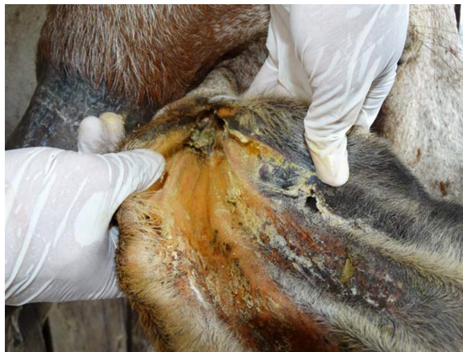
Fig.2. Pavilhão auricular de bovino da raça Gir com aumento de cerúmen e crostas devido ao parasitismo por larvas de Rhabditis blumi .

No presente relato os bovinos apresentavam leve a intenso lacrimejamento uni ou bilateral (Fig.4). Ao exame microscópico do material coletado do saco conjuntival foi diagnosticada a presença do parasita em 90% (9/10) dos bovinos. Rezende (2010) demonstraram uma correlação forte entre o lacrimejamento e os casos de otites. Esses autores mencionaram ainda que, quanto maior a presença do corrimento ocular maior era a presença do parasita nos condutos auditivos externos (CAE), e sem exceção, todos os bovinos que apresentavam o corrimento ocular uni ou bi-