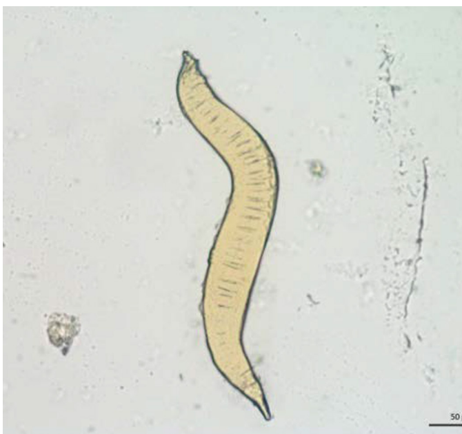
Fig.5. Espécime de Rhabditis blumi coletado do saco conjuntival de bovino da raça Gir com otite e analisada entre lâmina e lâmina em microscopia óptica. Obj.20x.