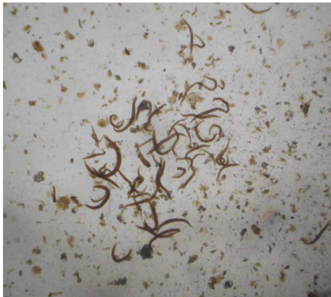
Fig.3. Espécimes de Rhabditis blumi coletados do pavilhão auricular de bovino da raça Gir e analisadas entre lâmina e lamínula em microscopia óptica. Obj.4x.