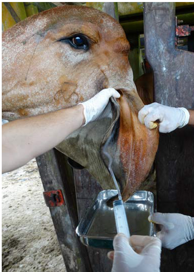
Fig.1. Coleta de material através de lavado do conduto auditivo externo em bovino da raça Gir com otite.

O material coletado com swab e lavado foram avaliados macroscópica e microscopicamente. Para o exame microscópico foram adicionados 5ml de solução fisiológica ao material coletado com swab . Essas amostras e as provenientes do lavado foram centrifugadas em centrífuga modelo LS 3 PLUS-CELM por 10 minutos. Após esse procedimento, o sobrenadante foi descartado e uma gota do sedimento foi colocada em uma lâmina de microscopia, acrescida de uma gota de lugol, coberta por uma lamínula para posterior visualização em microscópio modelo ECLIPSE E200. Adicionalmente, foi coletado material do saco conjuntival de 10 animais, com o uso de swab para pesquisa do parasita. Após a coleta, as amostras foram processadas de acordo com os procedimentos adotados para as amostras coletadas por swab do pavilhão auricular (Leite et al. 1994). O exame clínico geral e específico do sistema nervoso foi realizado de acordo com Dirksen et al. (1993).