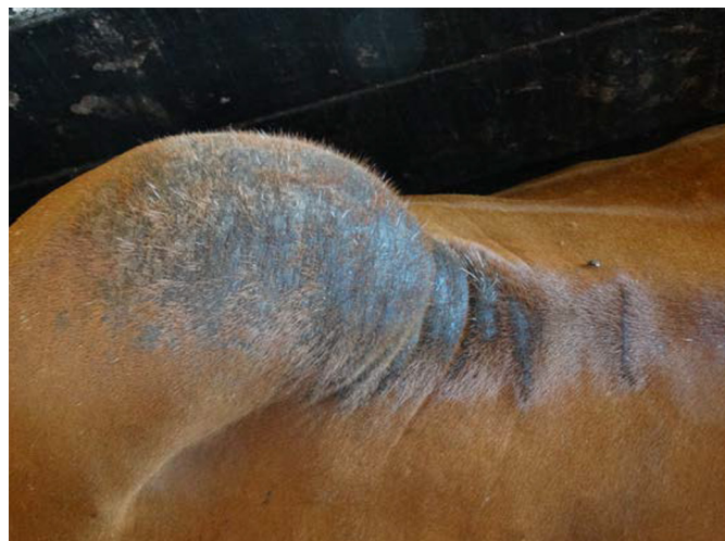
Fig.6. Bovino da raça Gir com otite causada por larvas de Rhabditis blumi . A alopecia na região do cupim foi causada pela fricção dos próprios chifres durante o desconforto e estresse do prurido da região auricular.

Também foi observado que alguns bovinos apresentavam alopecia na região da cabeça provocada pela fricção desta região nas cercas dos currais. Os bovinos também friccionavam a pele do cupim (Fig.6) com os próprios chifres, causando lesões alopécicas semelhantes às encontradas na cabeça. Essas lesões de pele eram causadas pelo desconforto e estresse ocasionados pelo prurido da região auricular, alterações que ainda não havia sido descrita por outros autores. Os raspados de pele das regiões alopécicas resultaram negativos.