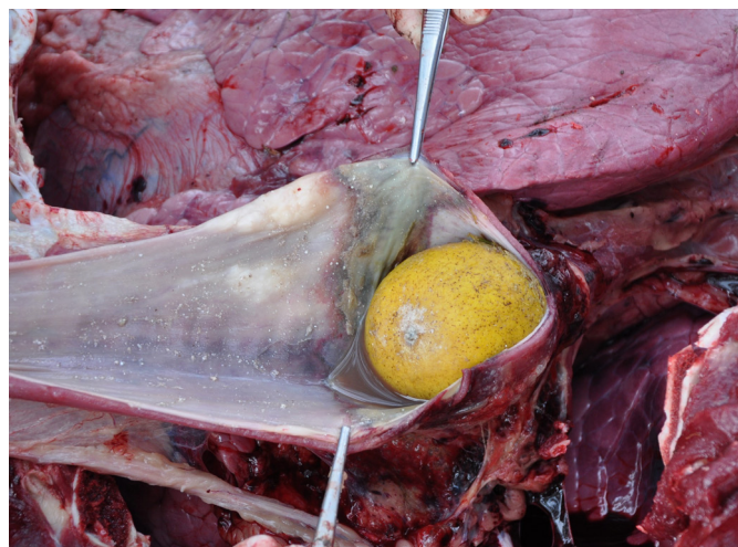
Fig.2. Bovino com timpanismo ruminal secundário. Obstrução total por limão siciliano na porção final do lúmen esofágico. Note também a área extensa de necrose na mucosa do esôfago no local da oclusão.