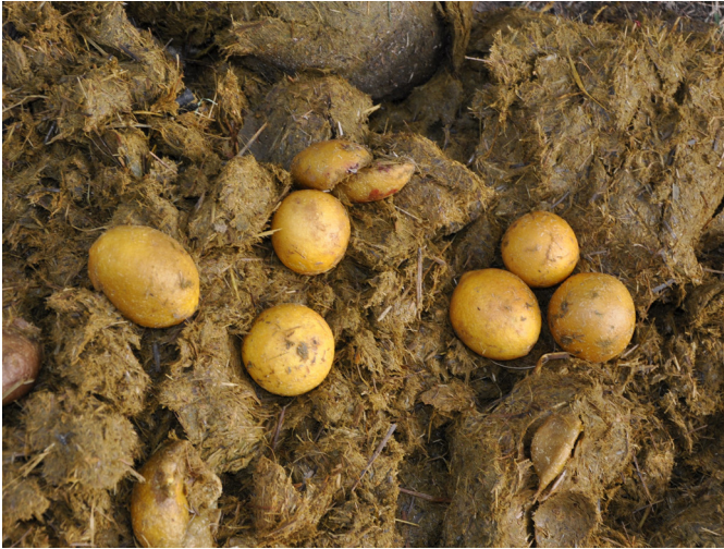
Fig.3. Bovino com timpanismo ruminal secundário. Conteúdo do rúmen com numerosos limões inteiros.