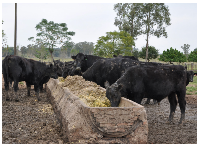
Fig.1. Bovinos alimentados com grande quantidade de resíduo de tangerina no cocho.

Cinco bovinos jovens, de um lote de 210, foram afetados por uma doença aguda fatal. Os casos ocorreram no mês de maio de 2015, em uma propriedade rural no município de Triunfo, Rio Grande do Sul, Brasil. Os bovinos desse lote estavam em campo nativo com boa oferta de gramíneas e há algum tempo eram suplementados com grande quantidade de resíduo de tangerina ( Citrus reticulata ) no cocho (Fig.1). Na última carga desse subproduto remetida para a propriedade, havia um grande número de limões sicilianos inteiros misturados acidentalmente ao resíduo. Os cinco