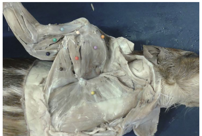
Fig.2. Musculatura do ombro e braço de Cuniculus paca adulta em vista medial. A pele, a musculatura cutânea e os músculos peitorais e braquicefálico foram removidos. Observam-se m. serrátil (bola amarela), m. grande dorsal (bola marrom), m. redondo maior (bola vermelha), m. subescapular (bola lilás), m. supraespinhoso (bola laranja), m. tensor da fáscia do antebraço (bola preta), m. tríceps (bola verde escura), m. bíceps braquial (bola azul clara) e m. coracobraquial (bola salmão).