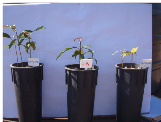
Figura 8. Detalhes de plantas de mogno africano tratadas com soluções nutritivas completa, com omissão de potássio e testemunha, aos 210 dias após início dos tratamentos.

Para Malavolta et al. (1997), o sintoma de deficiência nutricional de potássio, se manifesta com o aparecimento de clorose e necrose nas margens das folhas velhas. Faquin (2005) atribui esse evento ao acúmulo de putrescina, causado pela redução na síntese protéica e acúmulo de aminoácidos básicos em plantas deficientes em K.